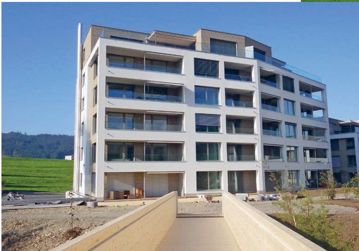
Der Aufbau der Holzbrücke über das Kett.