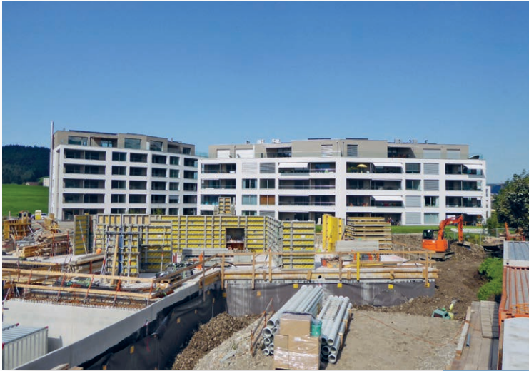
Die Rohbauphase der 2. Etappe hat begonnen.