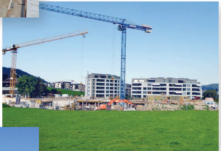
Die Tiefbauarbeiten haben einige Zeit in Anspruch genommen.