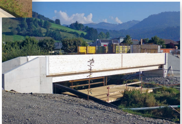
Die Holzbrücke kurz vor ihrer Vollendung.